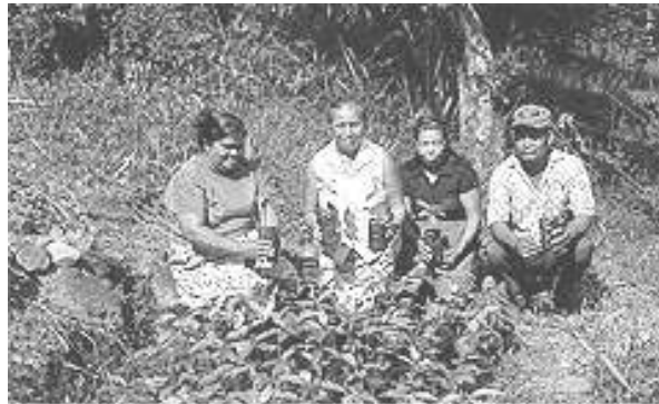
Die Frauen von Machuca pflanzen Setzlinge ein um eine Quelle zu erhalten

So hilft PROMESA zum Beispiel einer 14-köpfigen mestizischen Frauengruppe beim ökologischen Anbau von Getreide und Gemüse. Neben der Landwirtschaft fertigen die Frauen Panamahüte, haben jedoch wenig Erfahrung in der Vermarktung ihrer Produkte. Auch hier gibt PROMESA Starthilfe.