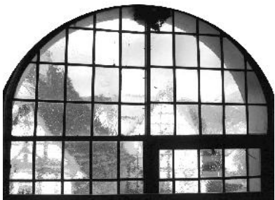
Blick aus dem rückwärtigen Fenster

Vor wenigen Wochen sind zur Sanierung der rückwärtigen Fassade der Christuskirche von der Landeskirche und vom Kirchenkreis 95.000 Euro bewilligt worden. Diese Mittel werden wir dazu benötigen, die schadhafte Balken auszutauschen, die Fenster zu sanieren und diese vom Wetter sehr in Anspruch genommene Seite mit einem Schieferbehang zu verkleiden.