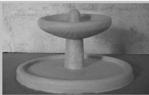
Brunnenmodell von Architektin Bärbel Grimm

Auf dem neu entstehenden Kirchhof nördlich des Turms soll der Brunnen ein lebendiger Haltepunkt werden für Menschen, die sich in diesem Bereich länger aufhalten. Dass wir dabei eine bereits bestehende Brunnenbohrung nutzen können und also nicht umgewälztes, sondern "lebendiges Wasser" fließen wird, ist sicherlich ein Glücksfall.