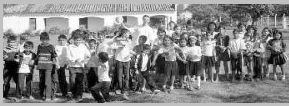
In die Schule zu gehen ist in manchen Gegenden Paraguays noch immer ein Privileg

Ein neues Weltgebetstagsland erwartet uns. Paraguay befindet sich seit 1989, dem Ende der 35-jährigen Militärdiktatur, in einem schwierigen Prozess der Umgestaltung, an dem sich Frauen auf vielfältige Weise beteiligen. Sie engagieren sich für Landreformen und schließen sich zusammen, um ihre landwirtschaftlichen und kunsthandwerklichen Produkte besser zu vermarkten; Frauen gründen Anlauf- und Beratungsstellen für von häuslicher Gewalt betroffener Frauen, sie engagieren sich im Bildungsbereich und im Gesundheitswesen. Frauen sind auch innerhalb der Kirchen aktiv im Aufbau der Zivilgesellschaft und der Sozialarbeit.