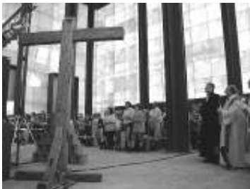
Christuspavillon in Volkenroda

In Volkenroda sind nach langer Zeit des Verfalls Kloster und Dorf wiedererstanden. Seit 1993 lebt in den alten Klostermauern die Jesus Bruderschaft Gnadenthal, eine ökumenische Gemeinschaft. Seit 2001 steht dort der Christuspavillon, das Wahrzeichen der christlichen Kirchen auf der EXPO 2000 in Hannover.